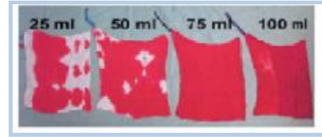
a: ارزیابی شان پارچه‌ای (آشکل)

استفاده از شان های پلاستیکی (drape) مدرج 1: این شان ها مخصوص جمع آوری خون و ارزیابی حجم خونریزی است.